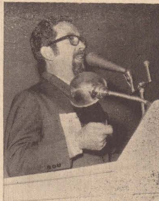
Está me parecendo que na atual conjuntura, deveremos alterar a lei do descenço.