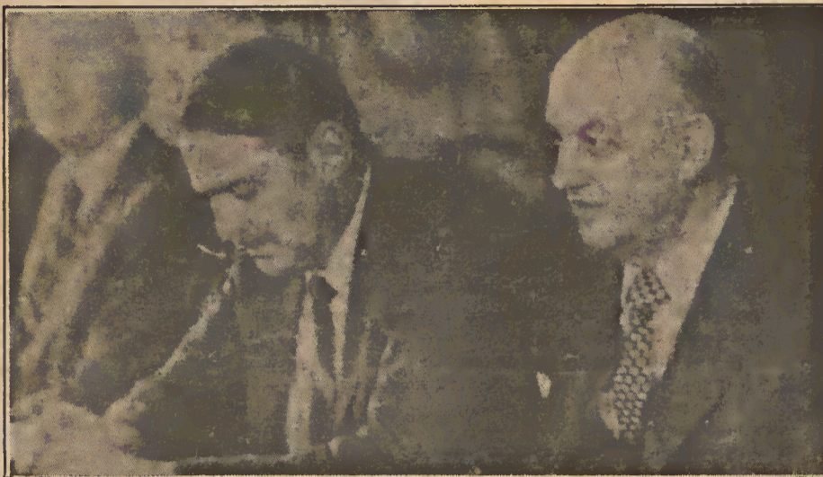
Pieter Botha, o odiado primeiro-ministro sul-africano.

Contra tudo isso e muito mais, ativas negros estão em constante mobilização para o desmantelamento das