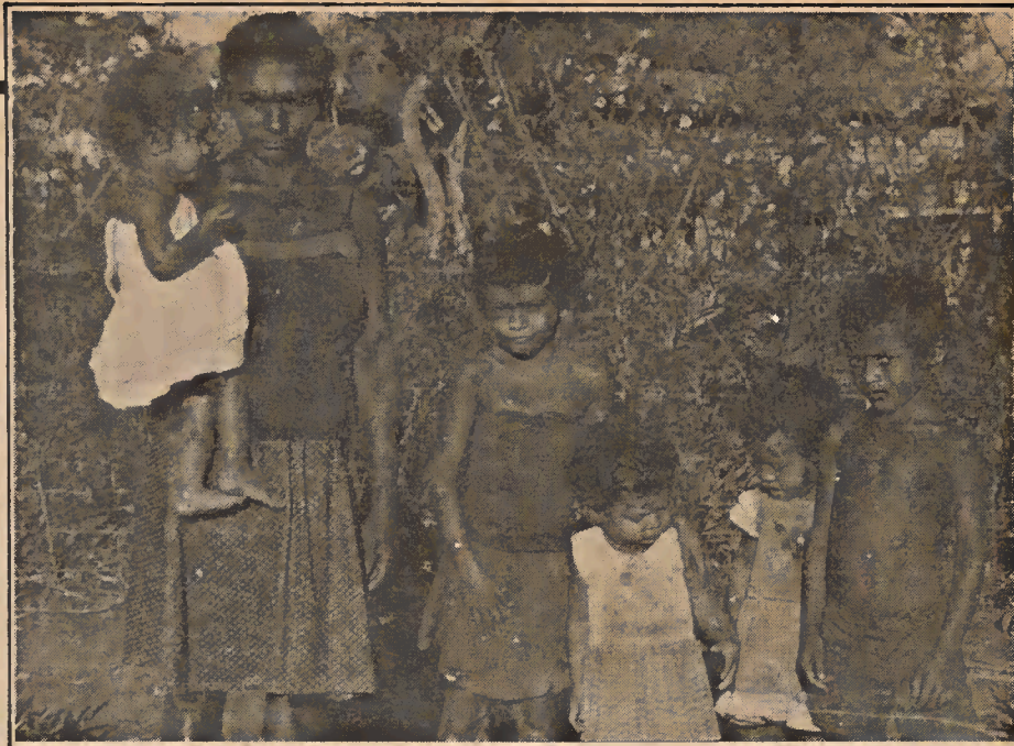
Questão agrária: tema de encontro do PT em Teodoro Sampaio.

● Tal medida justifica-se não só pela necessidade de fazer frente à Fundação Pedroso Horta, do PMDB, que começa a instalar-se no interior, mas também pelo fato de que a Fundação Wilson Pinheiro poderá absorver militantes cuja contribuição ao Partido tem sido sub-aproveitada devido à falta de