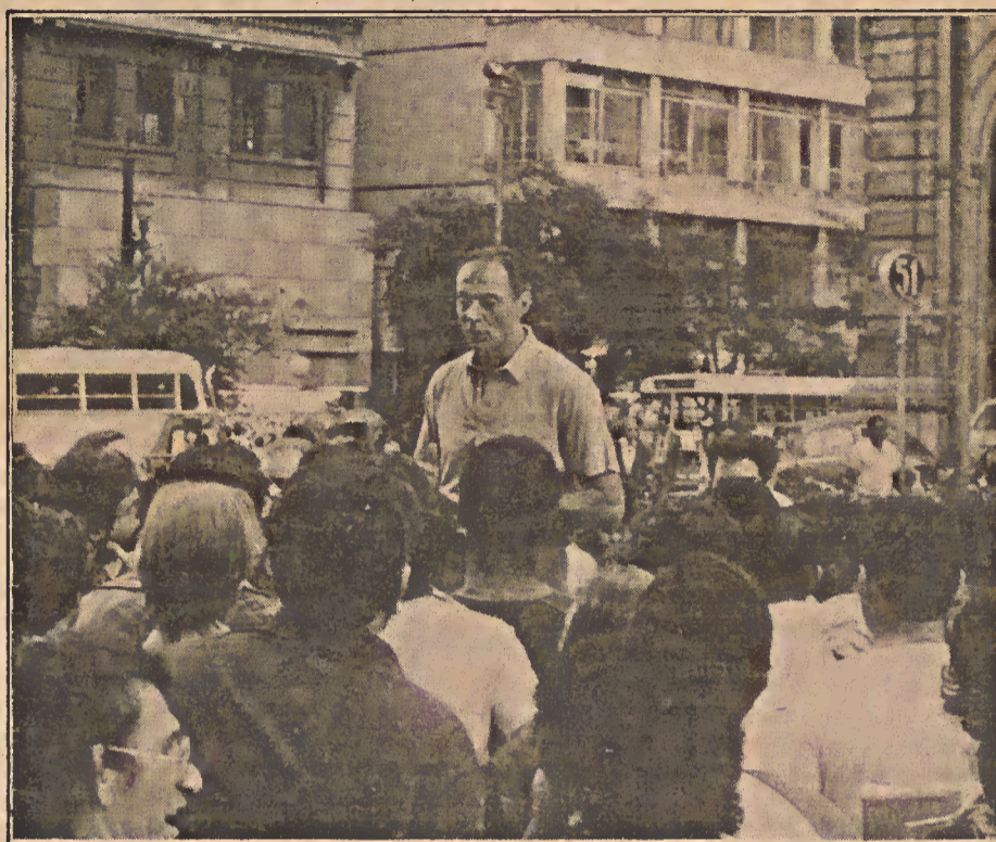
Um novo fator da campanha de Suplicy: o entusiasmo

ne como "alegre e festivo". "Esta festa acontece num momento em que a nossa candidatura cresce e que podemos nos transformar na opção para o eleitorado indeciso", confirma José Dirceu.