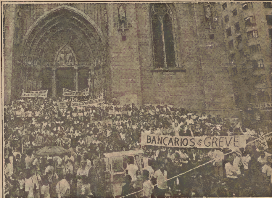
Praça da Sé

preparada para enfrentar todos estes obstáculos. E, especialmente, com a “clara consciência” - explica Gushiken — de que “necessitávamos de um forte apoio e simpatia da população”.