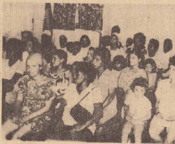
As senhoras presentes que receberam os enxovais, diversos mimos, e que aproveitaram bastante as aulas que foram ministradas.

"As vezes — disse — os clientes que já adquiriram as fichas para fazerem seus lanches ou refeições, são obrigados a jogar fora porque os ônibus já estão de partida e o atendimento não foi feito".