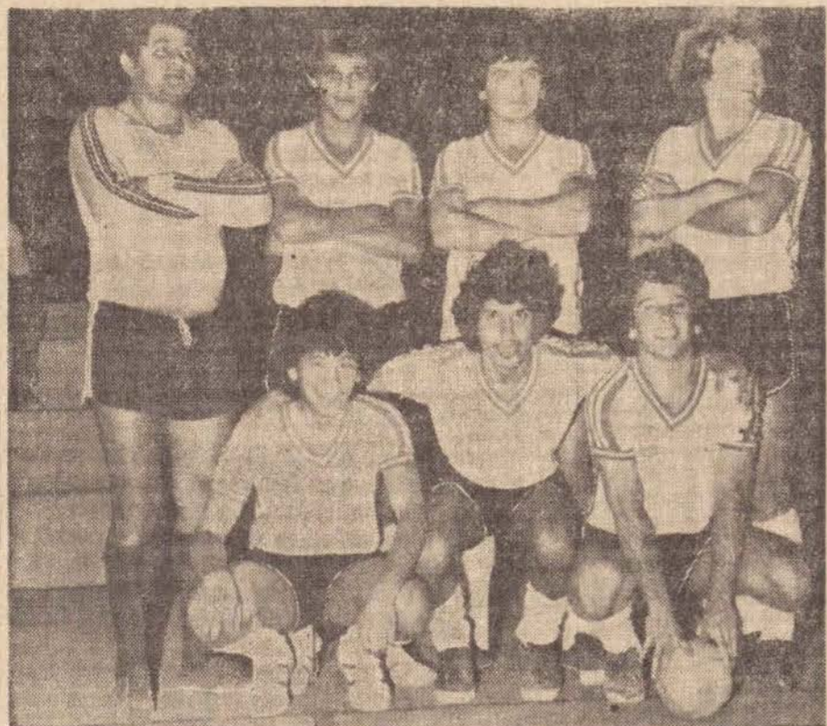
Equipe do Super Car Frios que participará do Campeonato Estadual de Futebol de Salão.

Terá início no próximo dia 28, estendendo-se nos dias 29 e 30, o Campeonato Estadual de Futebol de Salão, promovido pela Federação Paulista de Futebol de Salão, em sua divisão especial.