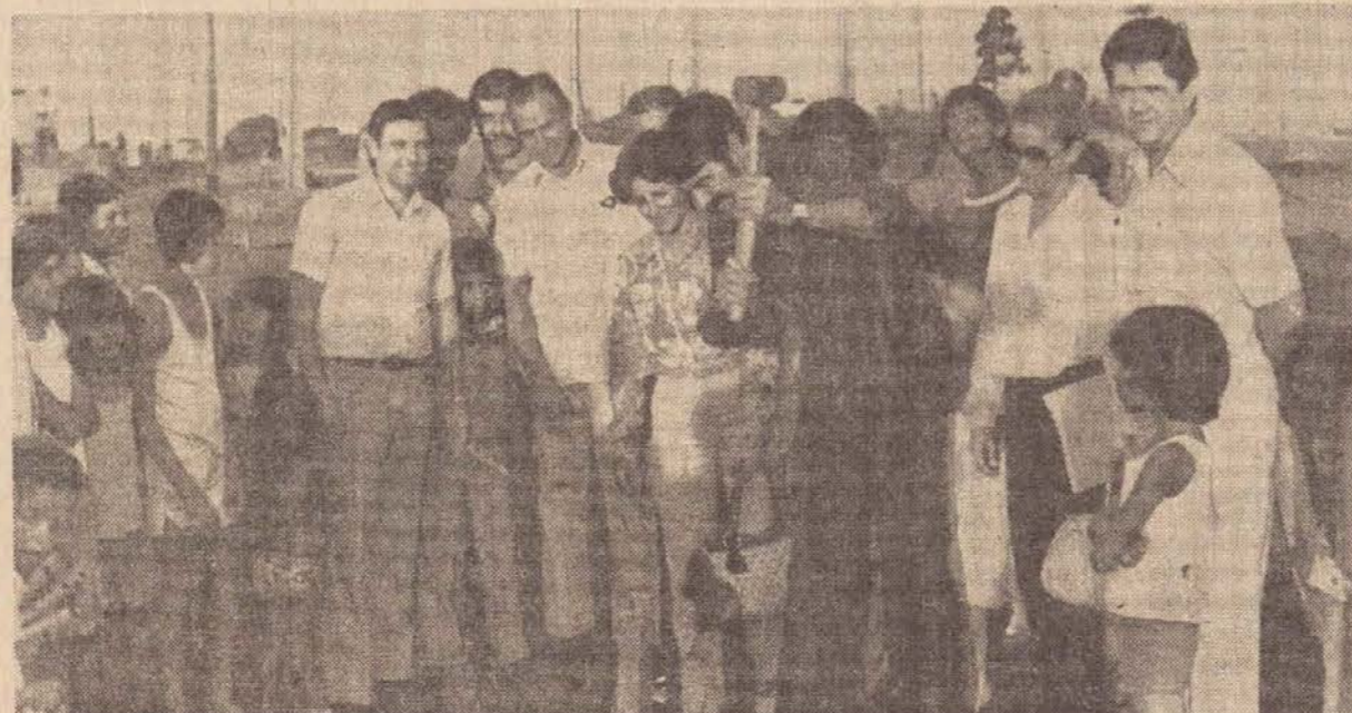
Momento em que o prefeito, oficialmente dava por iniciadas as obras da creche do Jardim Colina