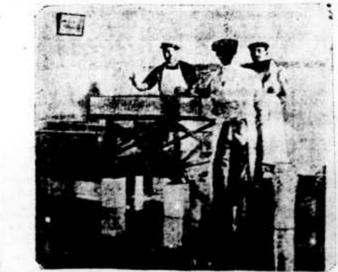
RECEPÇÃO DO LEITE

RUSSIA. VLADIVOSTOCK, 29. Prisão de Japonezes. A guarnição russa desta praça effectou a prisão de numerosos japonezes como accusados de exercerem a espiagem. PETERSBURGO, 29. As eleições á Duma. Nas eleições realizadas para a Duma verifica-se que foram eleitos 30 membros do centro, 62 da esquerda, 3 da direita, 33 sem partido. Houve 57 empates.