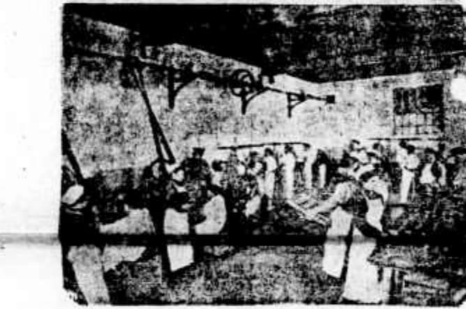
ENLATAMENTO DA MANTEIGA