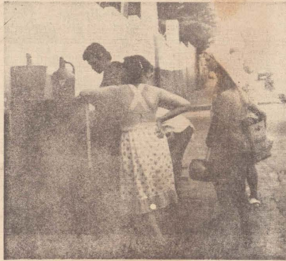
Onde há fontes, também existem extensas filas, em busca do precioso líquido que falta no centro e em muitos bairros da cidade.

Em outras considerações, nas quais faz críticas também ao prefeito, o deputado do MDB finaliza fazendo uma exortação "aos bancários, estudantes, donas de casas, operários, advogados, médicos etc. a se filiarem ao MDB para que possamos unidos, na próxima convenção municipal de julho de 1979 assumir o retorno municipal do MDB".