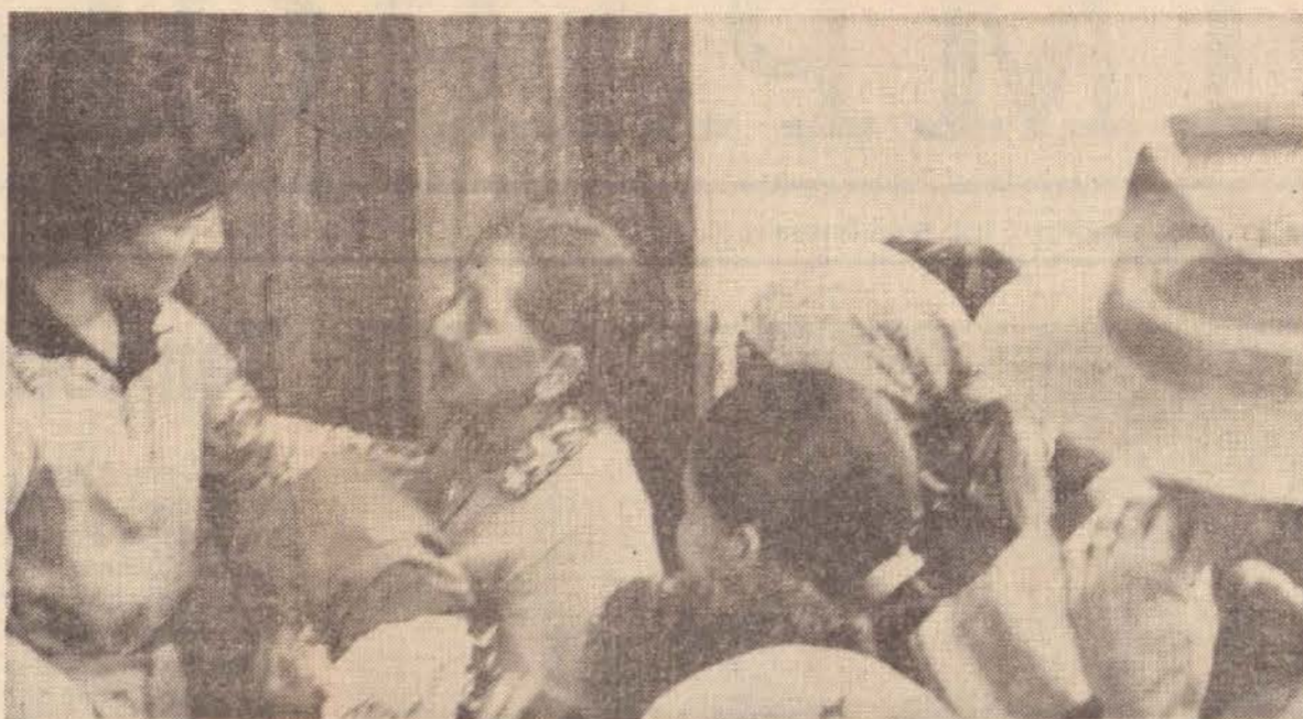
O serviço já foi implantado e muitas mulheres já estão comparecendo para este útil exame preventivo