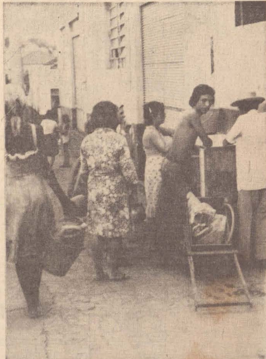
As fontes de água potável estão recebendo centenas de pessoas desde que a SABESP anunciou o racionamento.

"Não posso tratar de um assunto desses. Estamos sob o governo do presidente Gelsel. Como vou então ter antecipações. (AE)