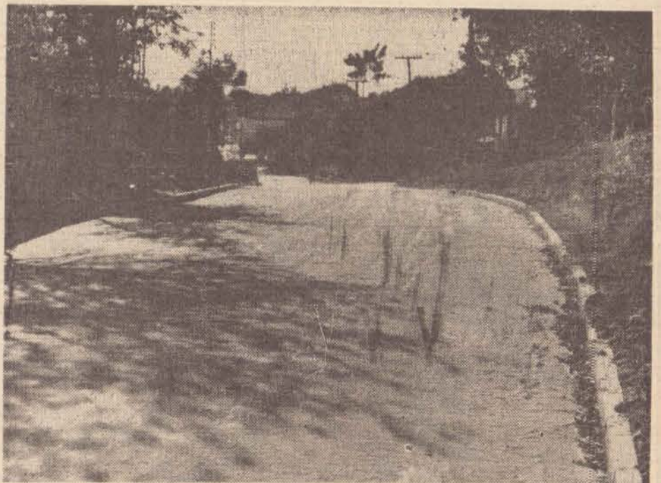
Após a pavimentação, as ruas ganham novo aspecto e a paisagem da cidade se moderniza.

Como o início de cinco frentes de trabalho, o Projeto Cura já se encontra em execução. A galeria do Tenis Clube está sendo retificada no trecho entre a rua Julio Prestes e Rev. Coriolano. Também está sendo executado o serviço de locação do correio de Veado.