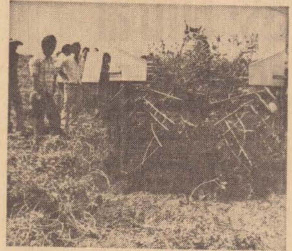
Um aspecto da demonstração realizada na última semana, em Tarabay.

Por iniciativa da Associação Brasileira de Exportadores de Amendoim, houve demonstração de uma máquina importada, reunindo cerca de 120 pessoas interessadas. Além de arrancar essa máquina (ira portada), agita, inverte e enleira.