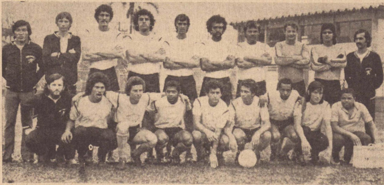
A equipe da Escola de Educação Física de Presidente Prudente, sagrou-se Bi-Campeã, de futebol nos jogos de Santo André, numa pose com todos seus elementos.