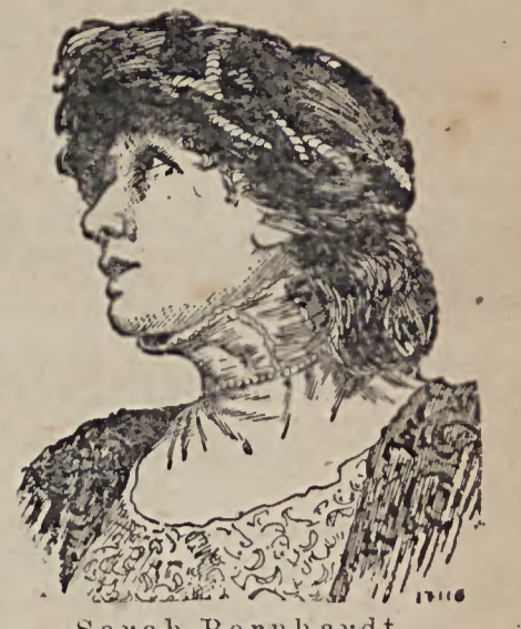
Sarah Bernhardt, die berühmte französische Tragödin, die am 1. September das 50-jährige Jubiläum ihrer Bühnentätigkeit beging.