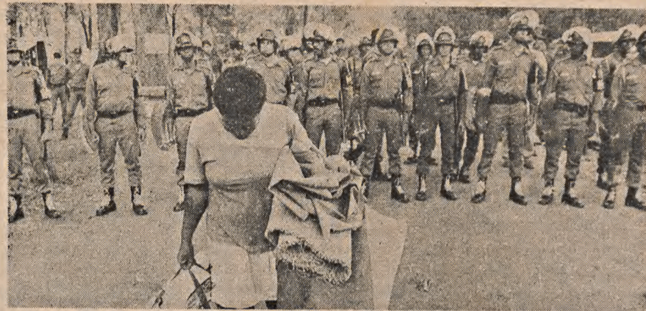
A violência da polícia força a retirada, mas os moradores voltam

O direito de morar precisa ser conquistado pela própria população. Violências como estas, onde governantes residentes de luxuosíssimas