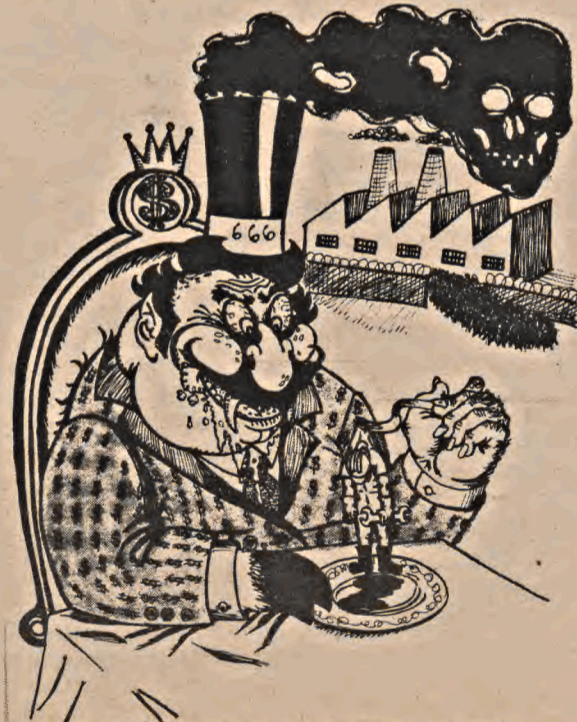
CADA VEZ QUE ELE RI, VOCÊ MORRE UM POUCO...

Embora necessite de alguns cuidados em sua instalação, colocar uma rádio livre no ar é simples e relativamente barato para uma comunidade. O AR NÃO TEM DONO. OCUPEM AS FREQUÊNCIAS DO AR.