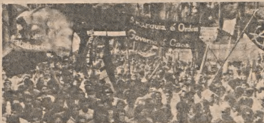
A Praça da Sé foi tomada por faixas e bandeiras anarquistas

Nos anos de 89 e 90, a esquerda oficial (oposição consentida como deve ser numa moderna democracia), festejou a data em Volta Redonda, palco dos massacres na CSN. Neste ano de 91 voltou à Quinta, com avais do "papai" Brizola e "titio" Marcelo, para mais um ato-show. Com tudo armado: palco bem equipado próximo ao lago, bandeiras tremulantes e rubras de tão socialistas que são, faixas de partidos, facções, grupos e grupelhos, centrais sindicais divididas e farta distribuição de panfletos e jornais revolucionários e corajosos. Realmente a mensagem foi clara: a hora está próxima. Basta que os verdadeiros representantes do povo tomem o poder com responsabilidade, pois eles sabem o que é melhor para todos. Só um detalhe embaçou a festa: o povão está cansado de palavrório estéril e não estava nem aí para a armação