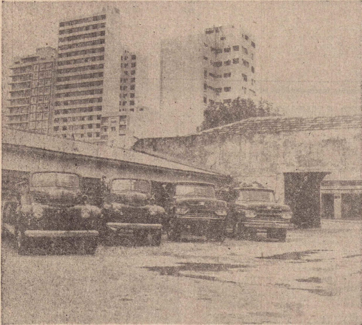
No combate aos incêndios e operações de salvamento, uma frota de 4: dois vão a 20 km por hora, um está a espera do tanque que não vem; o outro tem que se virar sozinho.

Em todo o mundo, hoje, os bombeiros estão recebendo inúmeras homenagens em comemoração ao Dia do Bombeiro. Nem nesse dia, porém, estarão livres das pe-