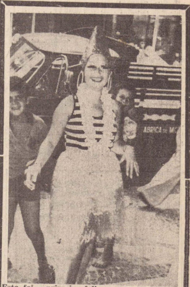
Esta foi a primeira foliã a aparecer publicamente na cidade. "A turma parece desanimada, por isso aqui está o meu entusiasmo", disse a jovem ao redator desta folha.

Segundo o correspondente da UPI, na capital chinesa há muito tempo nenhum visitante dos Estados Unidos teve uma acolhida tão popular na China.