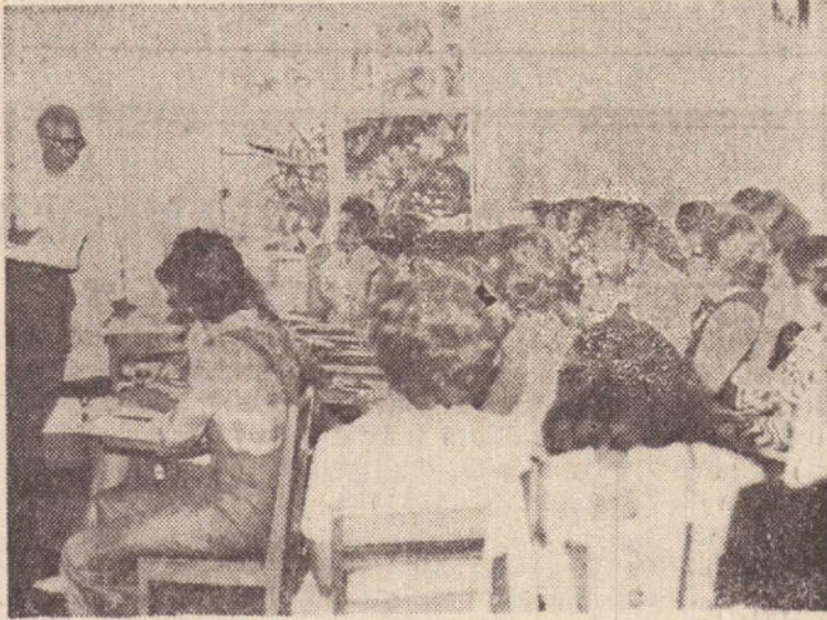
O professor ministrando uma de suas aulas, notando-se a atenção de todos

Teve início segunda-feira última, no Conservatório Municipal de Presidente Prudente, o Curso de Análise Musical e Pianoforte, da Música Brasileira.