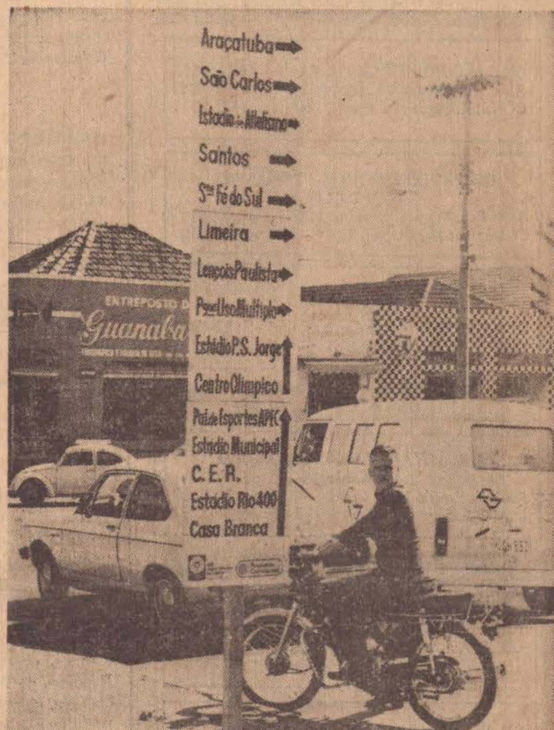
As placas indicando a direção dos alojamentos estão distribuídas em pontos estratégicos da cidade.