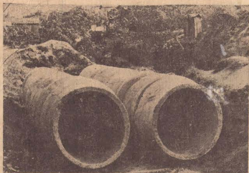
Após concluída essa galeria, toda a área de ambos os bairros será urbanizada.

Uma obra de infraestrutura que veio sanear antiga erosão localizada na área em que se encontram a Vila Lider e o Jardim Itatiaia, acaba de ser concluída. Uma tubulação de grandes dimensões foi