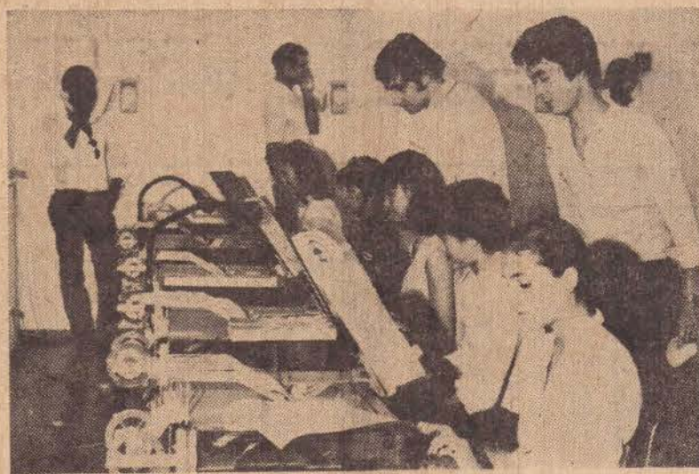
O comitê dispõe de 5 terminais de telex e vários telefônicos.