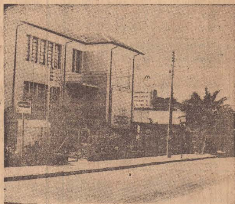
No Arruda Mello está a delegação de Santo André.

A informação foi dada ontem pelo secretário da Receita, Francisco Neves Dornelles, que fez um apelo a estes contribuintes — que declararam na cédula "G" (formulário dos rendimentos agropecuários), ganhos que obtiveram no exercício de sua profissão como médicos, dentistas, advogados, e outros, os quais deveriam ter sido declarados na cédula "D" — para que, espontaneamente, façam o pedido de retificação de suas declarações.