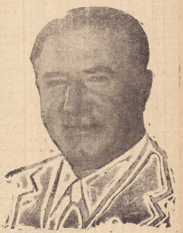
Adhemar de Barros concorrerá pelo PSP a sucessão do Professor Carvalho Pinto

ros, já aprovada e concluída a sua concorrência publica. Aquele obra, que abrigará todas as dependências de saúde no município deverá ter seu início em breve e o prefeito pretende antecipar as obras em apreço.