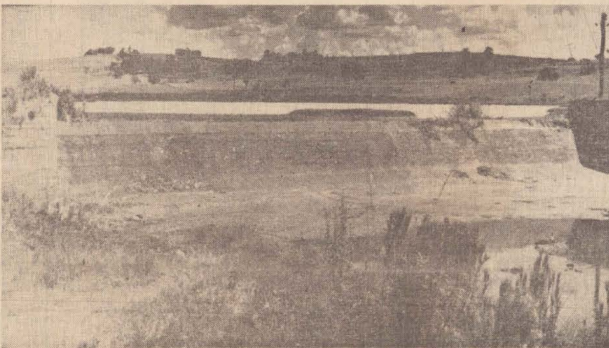
As chuvas deste ano, representaram apenas 15% da média dos últimos anos (29,8 mm). Como consequência, os mananciais estão secando.

de 6 milhões e 200 mil litros. Também haverá reaproveitamento da água de lavagem dos filtros do poço profundo do Jardim Regina e de outro poço semi-artesiano, a ser reativado na Vila Marcondes. A vazão do poço artesiano pode alcançar 500 mil litros por hora, enquanto a produção da Represa do Rio Santo Anastácio é de 280 mil litros.