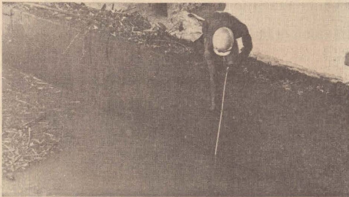
Aqui se pode observar o nível das águas da Represa: um metro abaixo da crista do vertedouro do Rio Santo Anastácio.

Segundo o Eng.º Carlos Alberto dos Santos, a solução para o problema do abastecimento não está tão distante. Com base em estudos realizados tempos atrás, a Sabesp iniciou a execução de um Reservatório-pulmão com capacidade para 4 milhões litros junto à Estação de Tratamento de Água e outro conjunto de reservação (Vila Formosa). A capacidade atual é