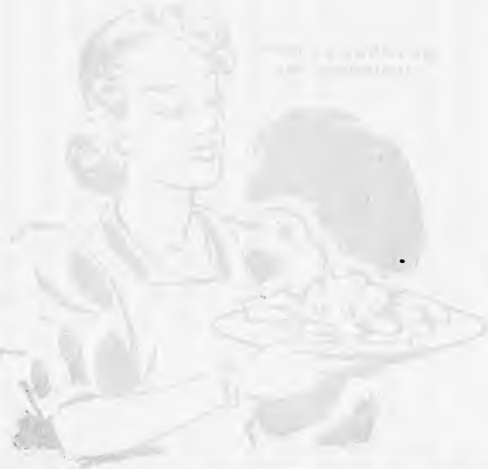
Para a mulher

F acilmente transportável para levar a qualquer momento sem custo de 25 centavos. CONDIMENTO - Excelente para saladas e para acompanhar a carne e o peixe. SALADA - Para acompanhar a carne e o peixe. CONDIMENTO - Excelente para saladas e para acompanhar a carne e o peixe. SALADA - Para acompanhar a carne e o peixe. CONDIMENTO - Excelente para saladas e para acompanhar a carne e o peixe. SALADA - Para acompanhar a carne e o peixe. CONDIMENTO - Excelente para saladas e para acompanhar a carne e o peixe.