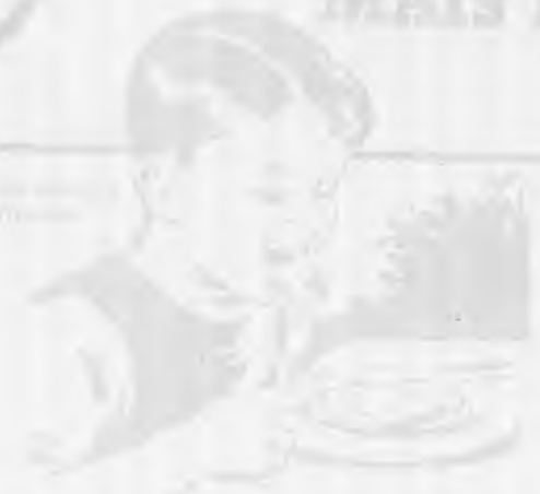
Para o menino