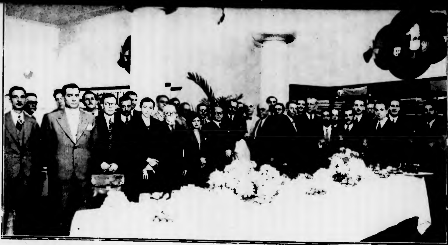
Gruppo di intervenuti all'inaugurazione dei nuovi locali