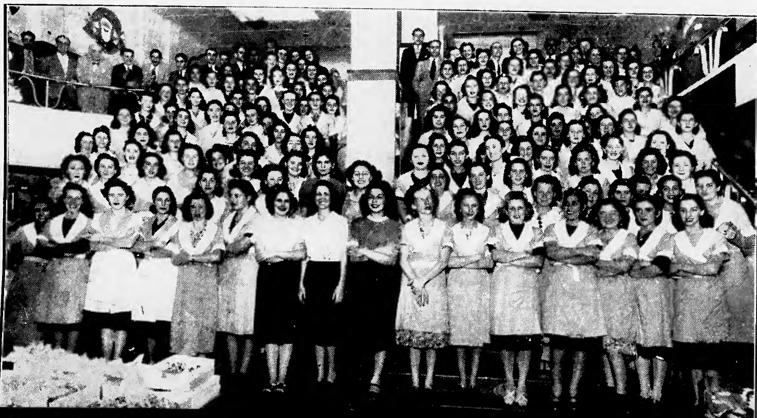
Simpatissimo gruppo delle graziose ed eleganti "vendenses" delle "Lojas Reunidas"