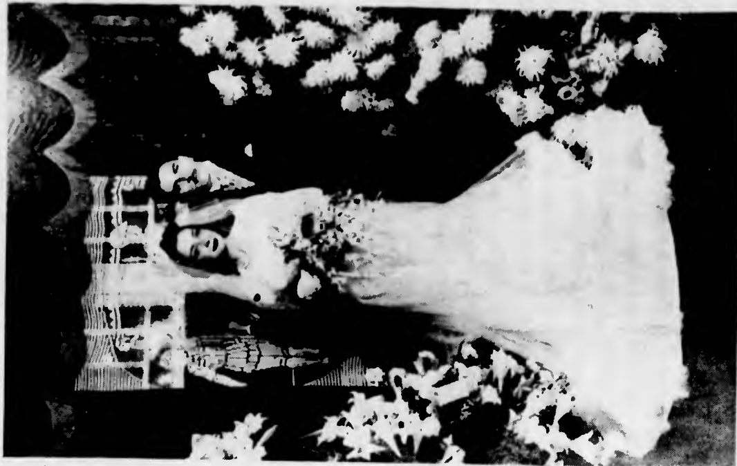
Gli sposi subito dopo la cerimonia nuziale

Il «Pasquino», nel registrare il lieto avvenimento, rinnova alla distinta coppia sinceri auguri di felicità.