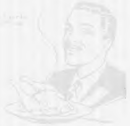
Para o homem