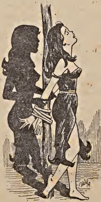
O Medo à Liberdade