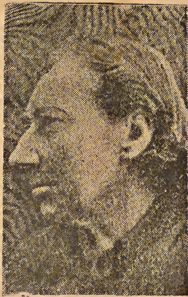
Luiza Michel — a grande combatente da Comuna de Paris e um dos grandes vultos da luta pela libertação humana

A 28 de janeiro de 1871, anunciada pelo Governo de Defesa Nacional a capitulação de Paris, por força do armistício assinado nessa data com o inimigo, começa para o povo francês, que toca a rebate e se compenetrado do senso de responsabilidade, a era da Comuna.