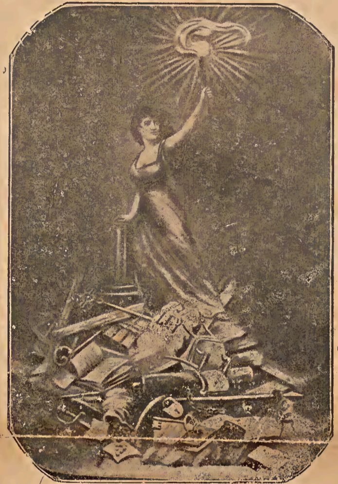
Símbolo alegórico das lutas gloriosas da Comuna de Paris

"De repente, ao meu lado, marchando conosco, vi minha mãe e senti uma angústia espantosa; inquieta tinha vindo; todas as mulheres estavam ali, marchando nas fileiras da liberdade, ao encontro da morte. Mas não era a