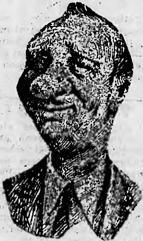
La figura marziale di Ras Mulugheta Ramenzoni

* Com'è bello banchettar, A cavallo d'un somar!