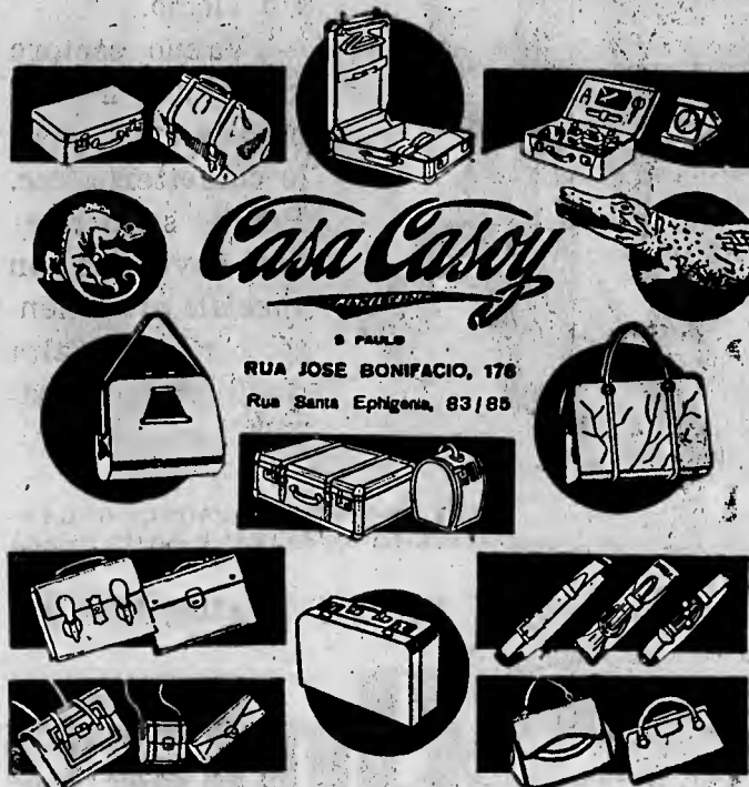
A MAIOR CASA ESPECIALISADA EM ARTIGOS DE VIAGEM, MONTARIA E ESPORTE

— Capirete!... — disse Jack, il bandito gentiluomo, e si morse la mano guantata.