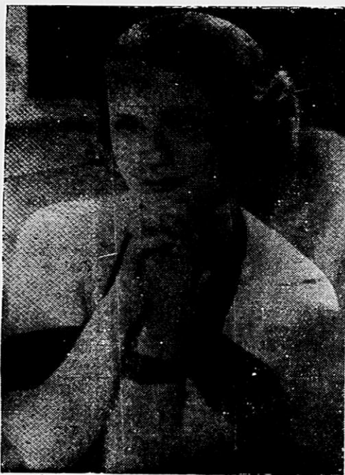
A' direita: Mae West

Ora, a arte de toucador dos tempos de hoje pode ter avançado muito com o auxilio de mise-en-plis , de ondulações permanentes, de mascaras de terra, de massagens electricas que enrijam a pelle, de mil e um cre-