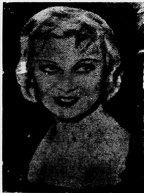
A' esquerda: Norma Shearer