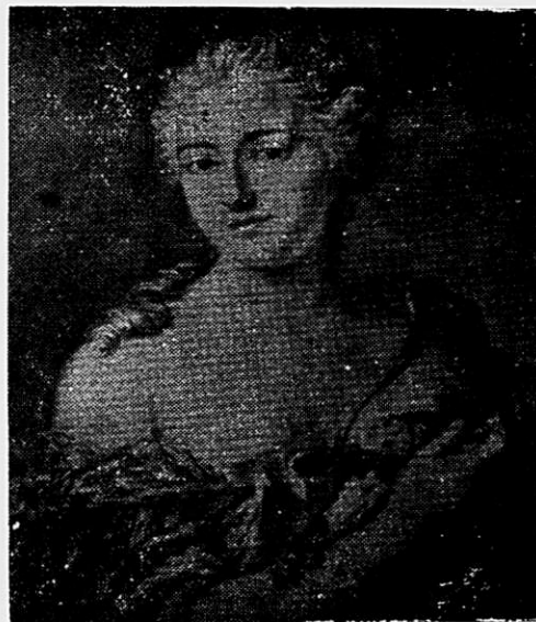
Madame de Pompadour