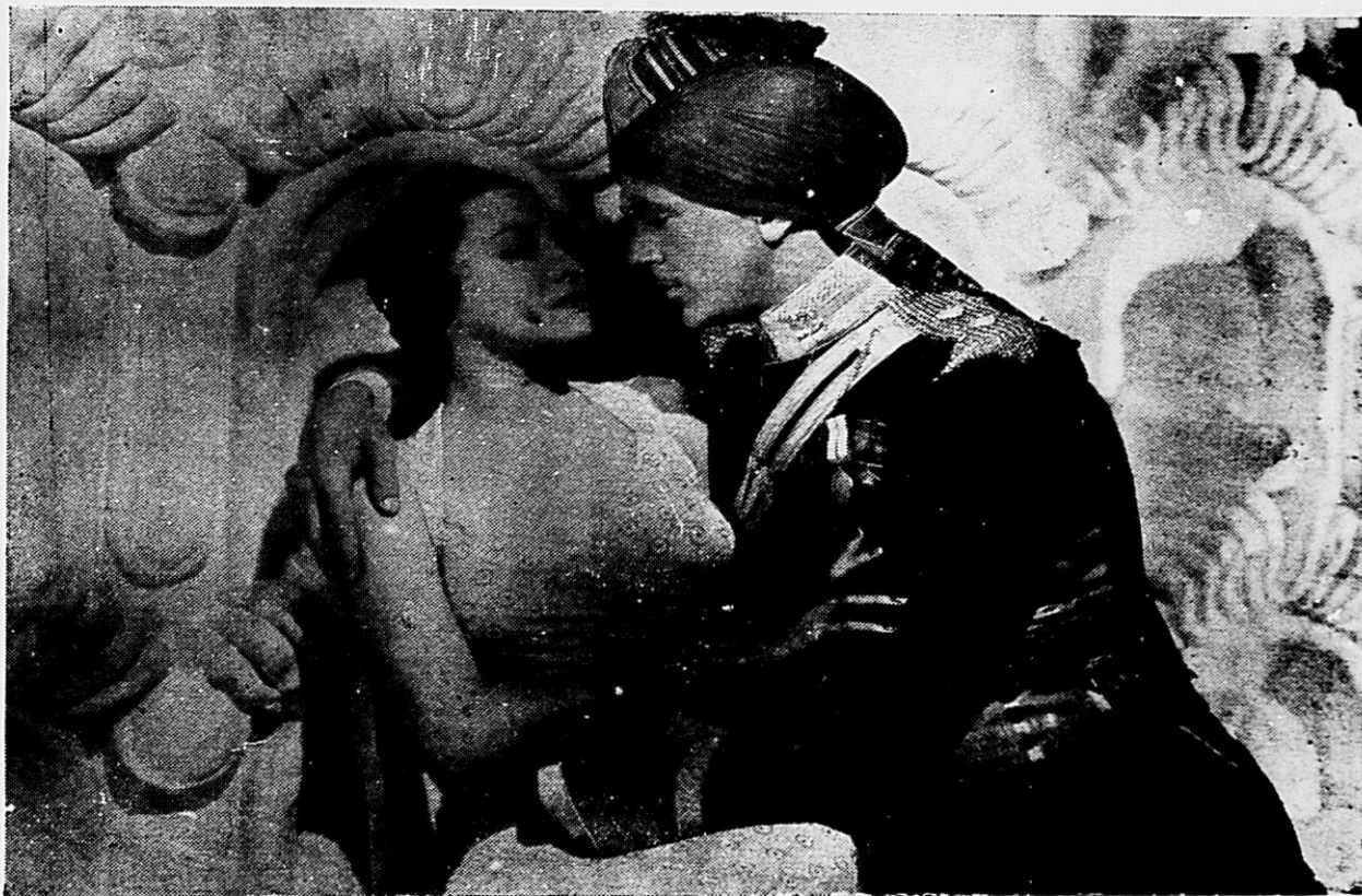
Gary Cooper e Kathleen Burke numa scena de proximo film da Paramount "The Lives of o Bengal Lancer"