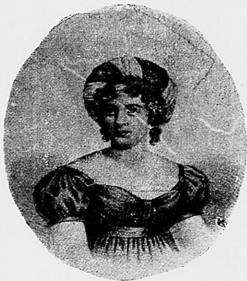
Madame de Stael

mes que aformoseam a cutis, mas a belleza não adiantou coisa que se visse. As damas de outros tempos eram lindas mesmo sem os engenhosos artificios hoje em voga. Usavam outros, é certo, mas não tinham a electricidade a auxilia-las, nem os modernos Institutos de Belleza em cujo seio os mais abalisados especialistas, diplomados por dez ou mais Faculdades scientificas, vieram substituir as fadas bemfazejas que, num abrir e fechar de olhos, transformavam velhinhas encarquilhadas em formosas princezas cheias de mocidade e graça, tocando-lhes apenas com a sua varinha de condão.