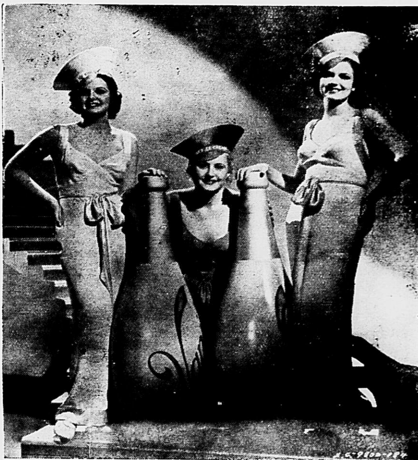
Tres encantadoras Goldwyn girls tal como apparecem na scena a toda cor na fita de Eddie Cantor "Chico Milhões" produzida por Samuel Goldwyn.