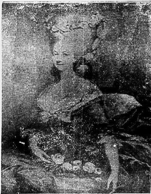
Princesa de Lamballe

Um dia, Napoleão quiz sustentar uma discussão com a illustre dama que, delicadamente, lhe mostrou o erro das suas afirmações, salientando-lhe que nem sempre um grande general poderia ser um grande politico.