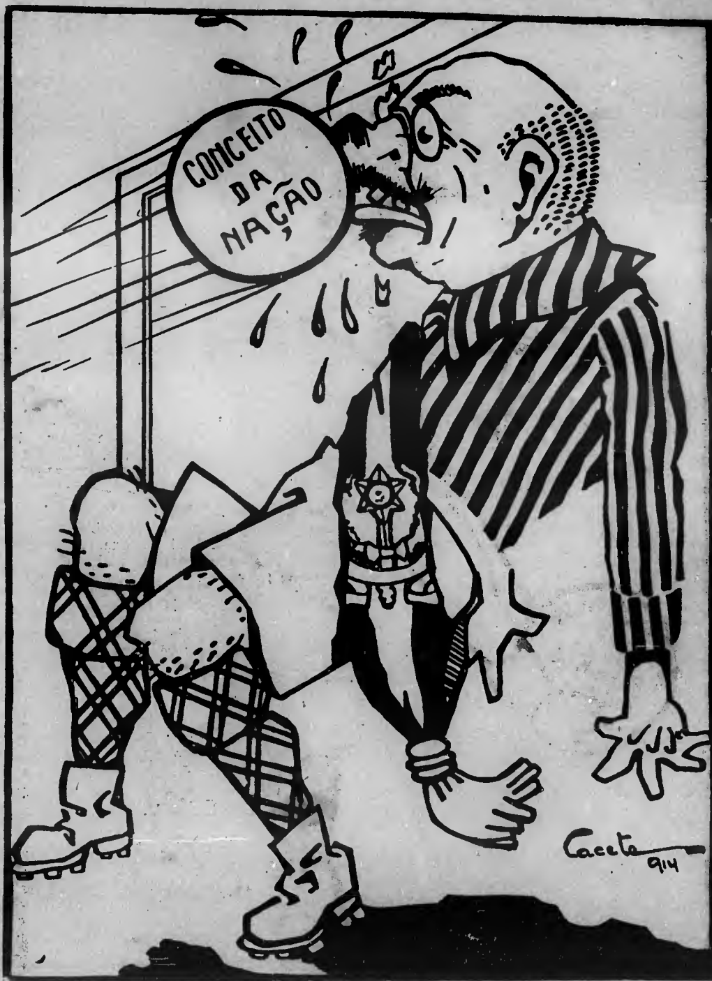
No "ground", da politica Nacional

Qual é o rapaz que dança com mais elegancia, em S. Paulo?