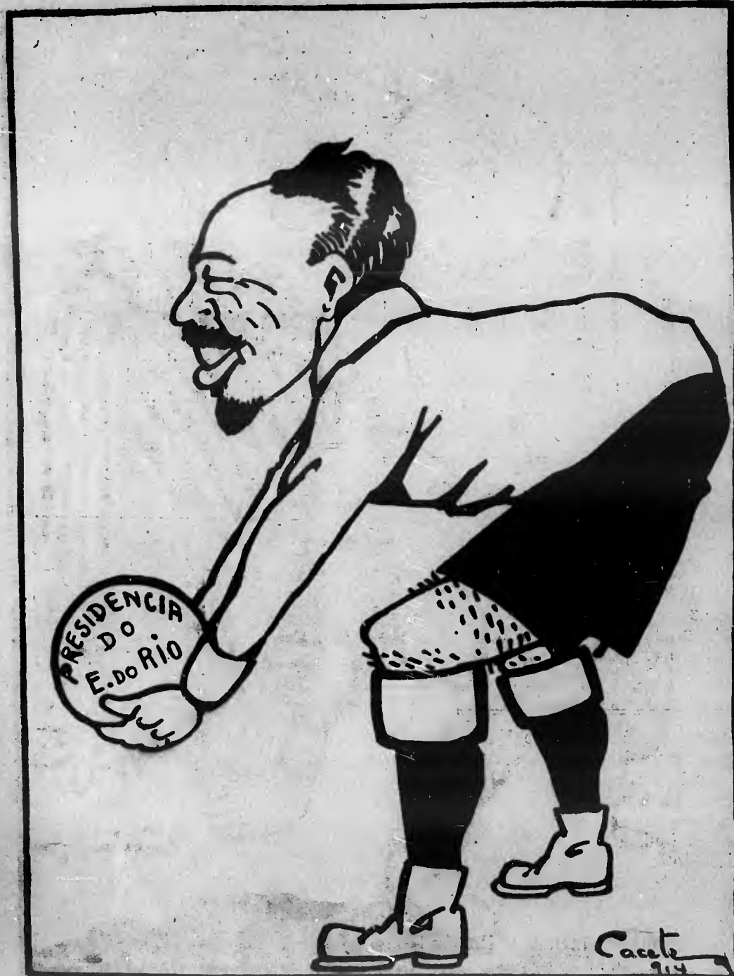
No "ground," da politica Nacional

Alguem chamou ha dias o Quarentei de avacalhado , devido ter o mes-