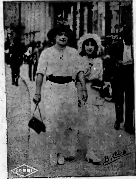
Fazendo o triangulo...

sariamente o enfermo ao ingerir a medicina?... Oh, não! Poupe-me por favor! Seja bondoso até o fim, meu caro, já que quiz tão gentilmente encarregar-se de dar um prompto allivio (não confundir com o especifico do mesmo nome para dôr de dentes) «à mes chagrins tristes et à mes peines pas gales»... Deseja saber o meu nome! Mas para que? Que importa á sabia solução que bondosamente vae dar ao caso, que a sua amiguinha se chame Maria ou Joanna?