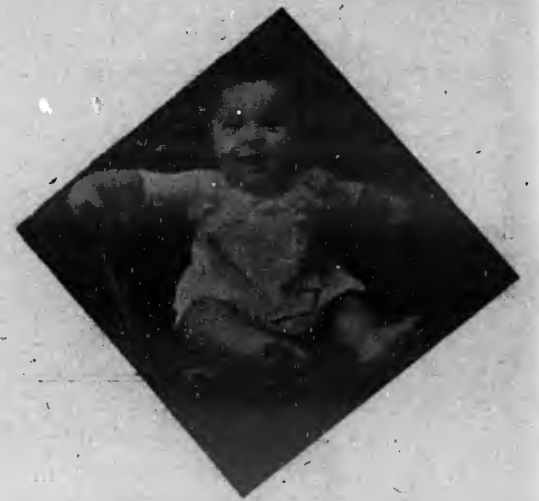
Posando para O PIRRALHO