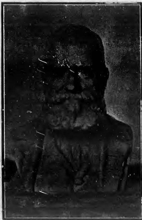
Um bellissimo trabalho de Motta Mello

Só tem callos quem quer. Querels um bom remedio? Pedi á PHARMACIA SEABRA.