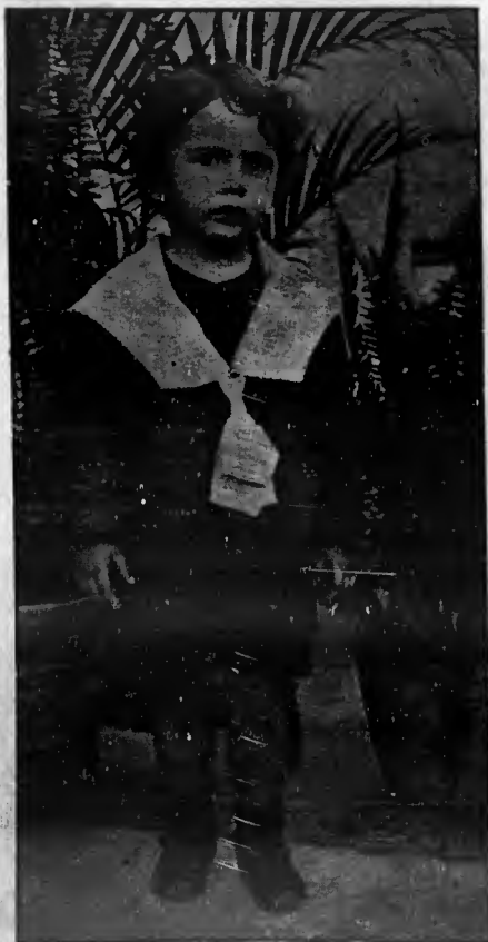
"Posando" para O PIRRALHO