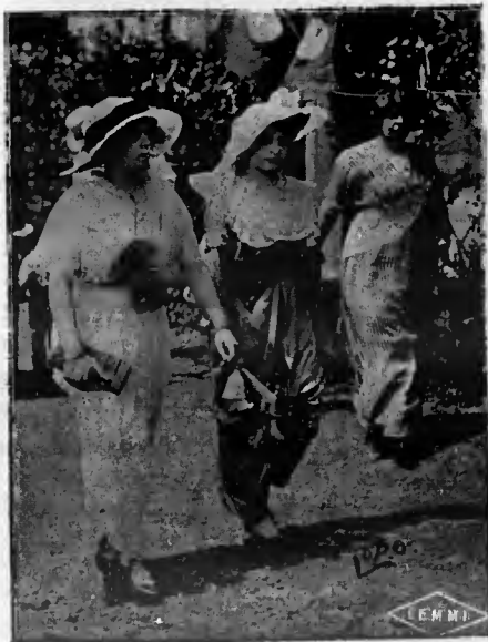
No Prado da Moóca