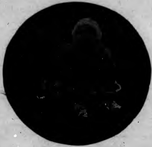
Posando para O PIRRALHO