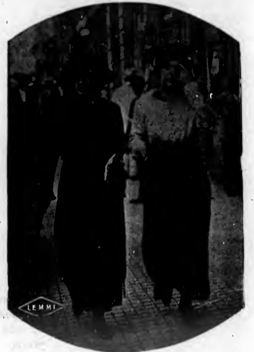
Na rua 15 de Novembro

menorizar de linhas anatomicas e de rigorosas perfeições da plastica.