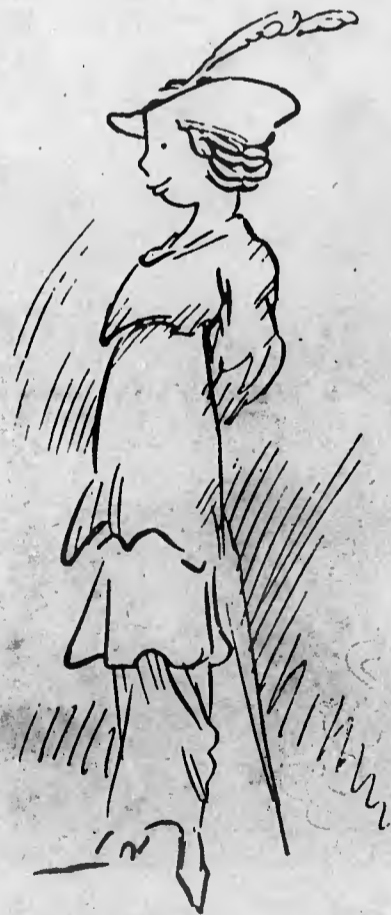
Uma distincta M.elle quarentona