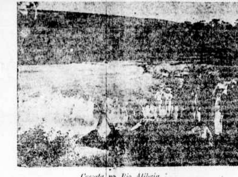
Cascatas do Rio Alibéria

ta mil francos se dia consentisse em partir para o estrangeiro. A linda rapariga recusou o dinheiro e mandou passar o fustigado.