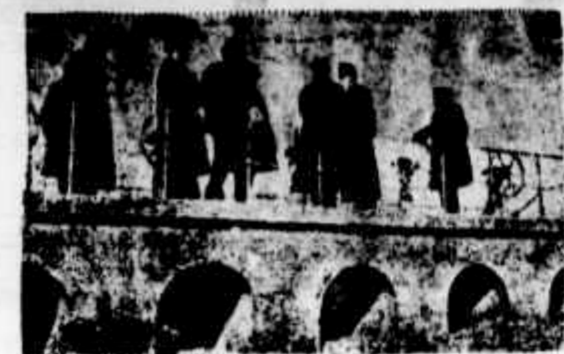
Inauguração das obras que dão sahida ás aguas

Ha cinco dias, porém, emulocou esse espetáculo.