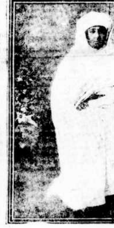
1) Patuio do sultão de Marrocos; 2) Ultima retrato de S. M. XERIFANA, o sultão

mas indigentes, que vivem do produzido da caridade publica; porém, esses pertencem a grande classe dos envorçados; que, as escudilhas, curtem a miseria, que, muitas vezes se não pôde aliviar, porque a defecatez do mendigo publico desviam para o seu mealheiro o obulo que lhes podia dar lenitivo ao sofrimento!