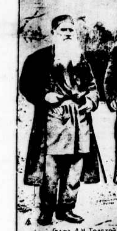
Paladinos da liberdade russa. Tiberio e Gorky

Fortunato hesitou um tanto ou quanto. Era um homem melindoso, inimigo de violencias, que não se resignava a ser bravo senão na ultima extremidade; e parecia-lhe que o sr. de Valorsay apertava a bengala de modo um tanto inquietado.