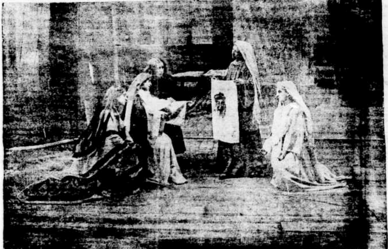
A scena da Verónica no drama A Paixão representado ultimamente com successo em Nancy (FRANÇA)

veitar-se da situação em que estava dando completa liberdade aos seus antigos companheiros, retirou-se á vida privada e disse á politica um adeus, tambem para sempre.