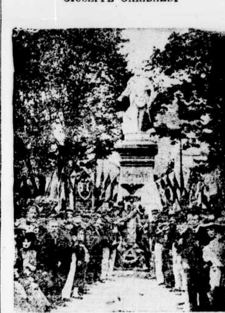
O MONUMENTO DE GARIBALDI—No square Lowendal em Paris

sempre, que a salvação da lavoura será a salvação da nossa patria.