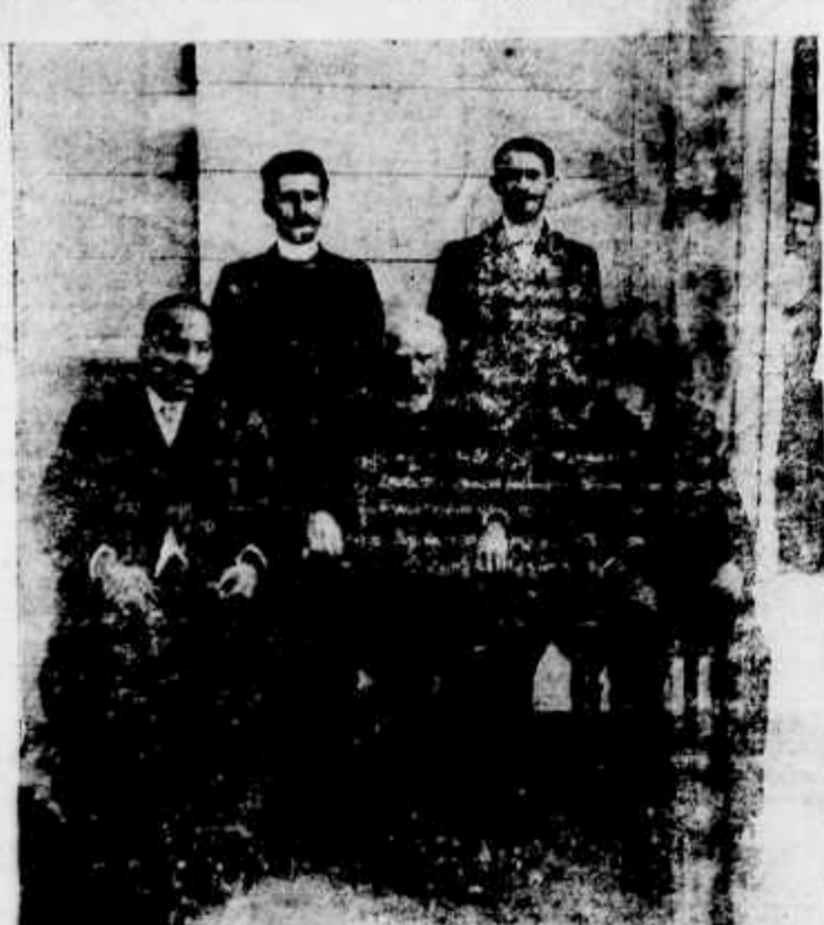
CORPO MEDICO DO HOSPITAL MILITAR