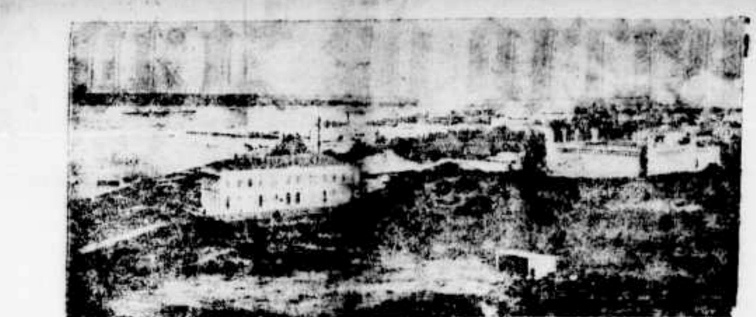
LOURENÇO MARQUES-VISTA GERAL