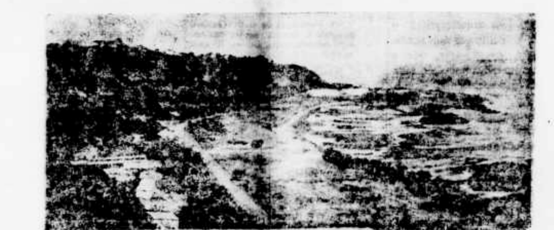
LOURENÇO MARQUES-POZ DO RIO ESPIRITO SANTO