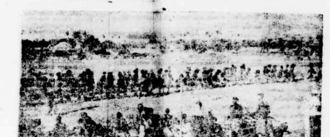
Revista dos indigenas em Lourenço Marques