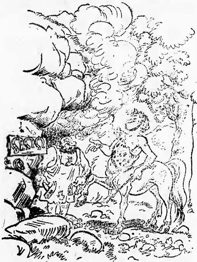
— Fatemi le unghie !

Poiché tutti gli altri giornali "italiani" di S. Paolo, in tutt'altre faccende affaccendati, non hanno il coraggio di occuparsi del caso del Palestra, resteremo noi soli a difendere l'italianità.