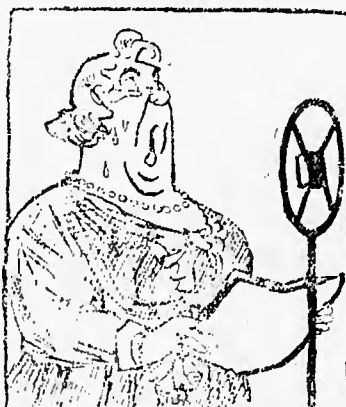
Davanti al microfono

Si raccomanda di immaginarsi di inzuccherar bene dato che la torta sportiva risulta di solito un boccone parecchio amaro a mandarsi giù.