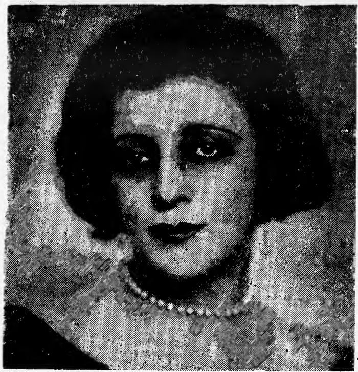
ITALA MARINA, della Canzone di Napoli.

CICCIA RIFORMA (Dell'Accademia Chiquinha dell'Oso)