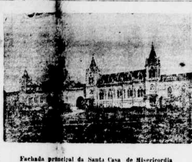
Fachada principal da Santa Casa de Misericórdia