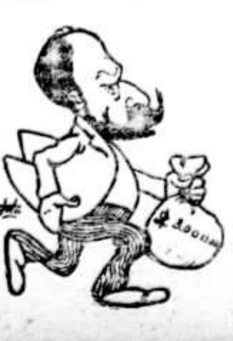
— Oh não! não! Não vale um... — Admova, meu São João, não me dá o seu diabo...

Não se trata de um bauto, de uma fantasia, de um romance inventado para encantar sensação trata-se de um crime e de immoralidades já affectas à arguição do poder judicial e satisficimento providas por varias testemunhas accordo. Tratase de factos reais, de factos decaivamente verificados e comprovados, aos quaes a Chamareria deu publicidade por estarem no dominio publico, antes e depois do inquerito.