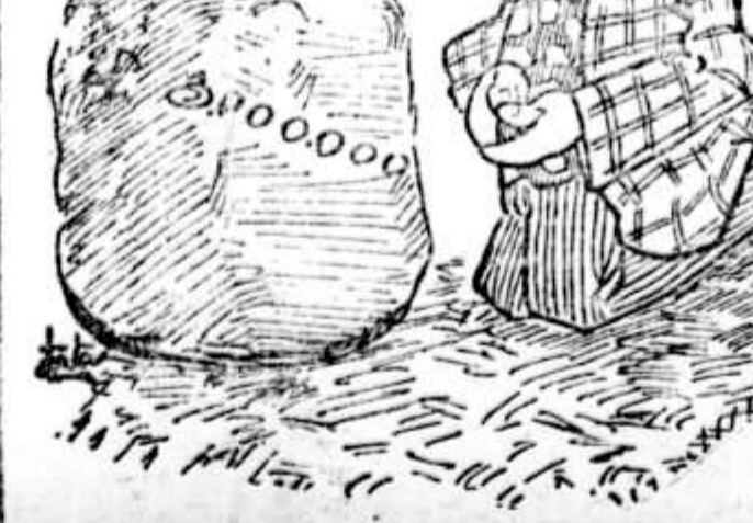
— Admova, meu São João, não me dá o seu diabo...

O sr. ministro da Fazenda envia a honraria ao secretario da Comara dos Deputados a mensagem do sr. presidente da Republica, solicitando a abstração dos creditos necessarios para pagamento de todas as despesas feitas com a publicação das novas moedas de prata durante o corrente exercicio.