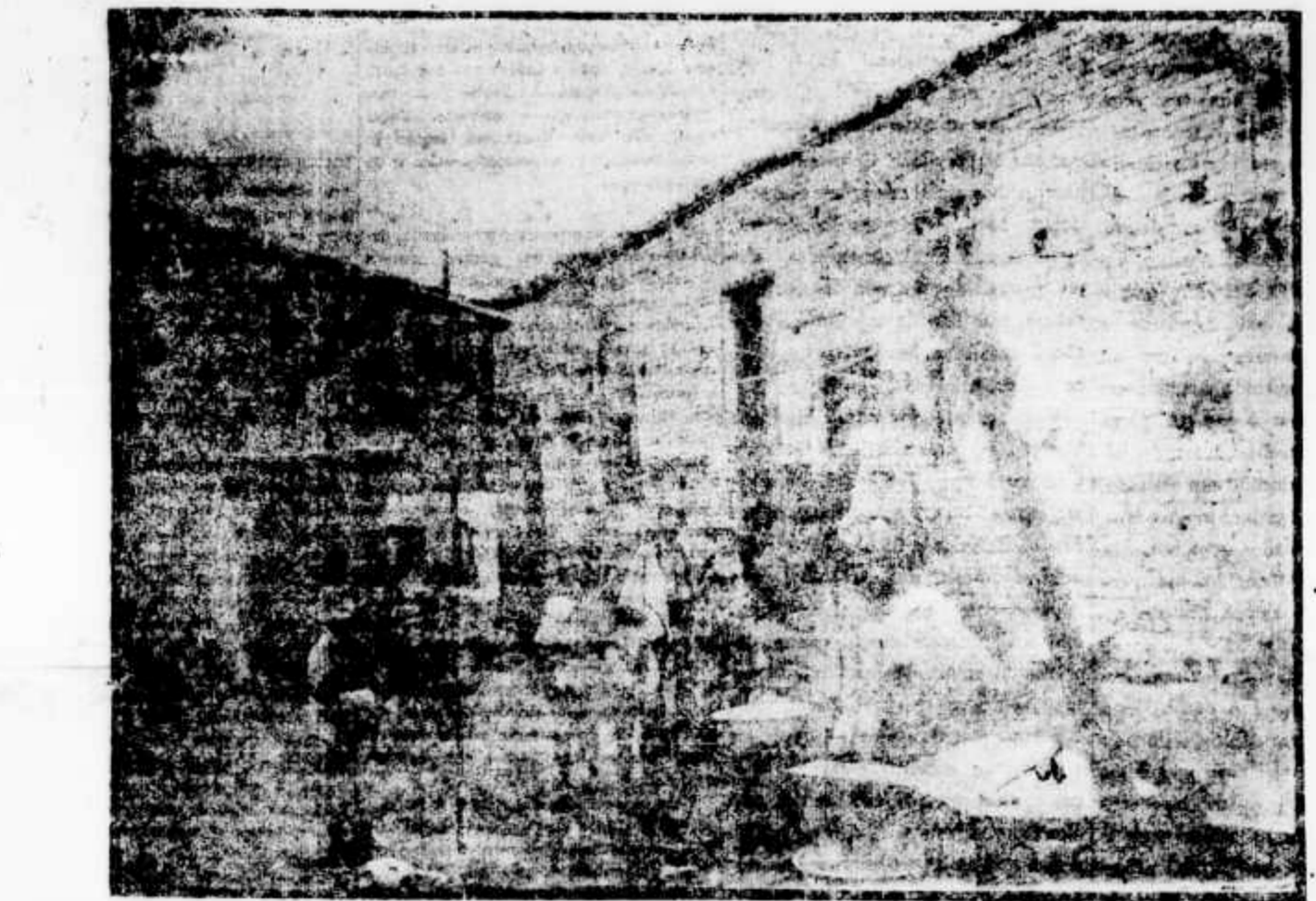
Outro cortiço da Avenida Rangel Pestana