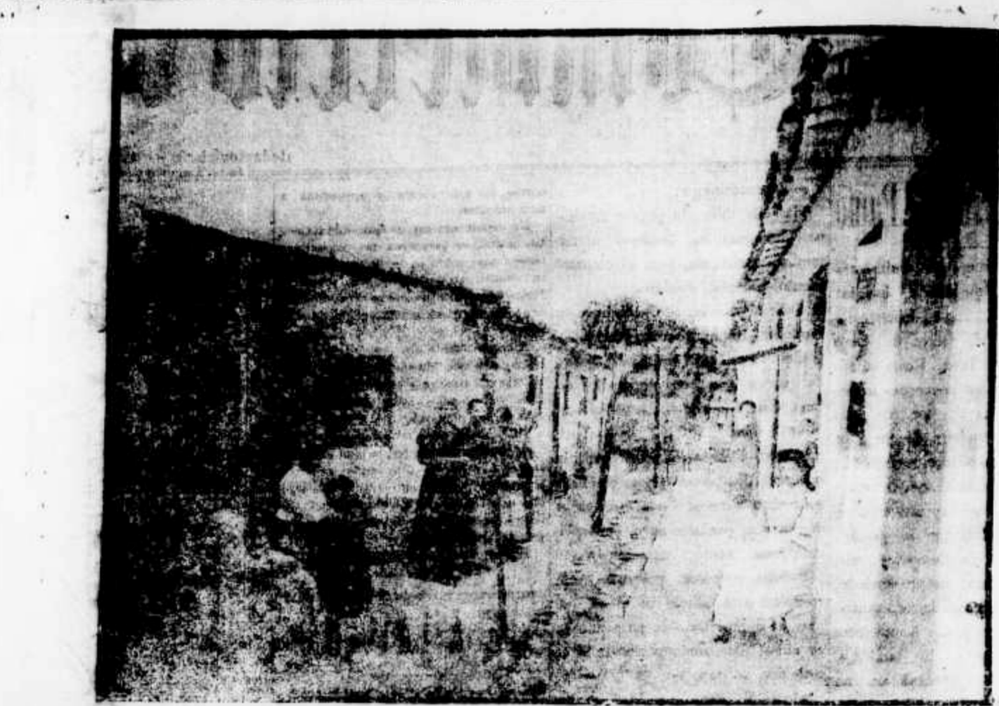
Cortiço na Avenida Rangel Pestana. Como esse ha muitos ani.