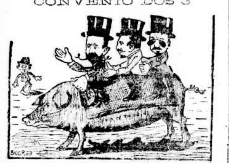
— Os estarmos os tres, repimpados solemnemente no lombo do capado. — Cidadão, que o chicho, está ariscoo...