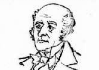
CAVALLEIRO DO HARNAL