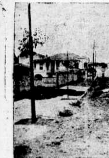
A pequena cruz branca indica o precipício de 20 metros de profundidade que a mais de um mez se acha com a guela escancarada e a espera de transeuntes incautos!

BUA MARIA PAULA—Os moradores desta rua, cansados de pedir providencias nos poderes municipais para os urgentes reparos que se fazem precisos nessa via publica, esbarcada, em parte, constituindo uma ameaça aos transeuntes incautos, tiveram a lembrança de nos enviar os clichés que adiante inserimos, e por onde se pode ver reconhecer a justiza dos seus clamores.