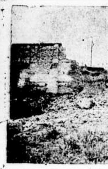
Este cliché mostra a garganta do precipício onde se amontou caros de garrafas, tijolos, canos rachados e lixo em quantidade suficiente para criação de ratonzas!