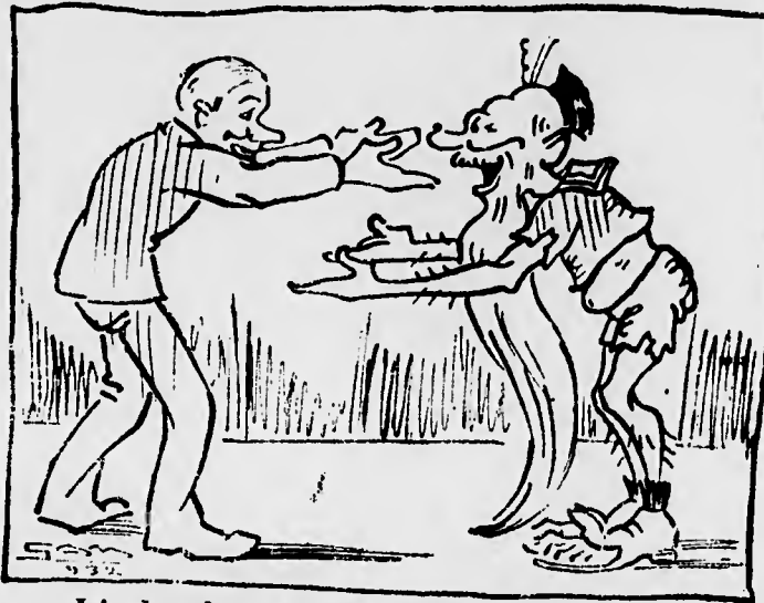
Lindembergh riabbraccia suo figlio

to da dieci ani, ci sono ainda dela genta che ci acredita, che parese, porca loca, una fola a riontarla.