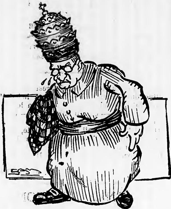
Il Papa — Non piango per me: piango per loro!

In Russia hanno condannato a morte il Papa. (Dai giornali).