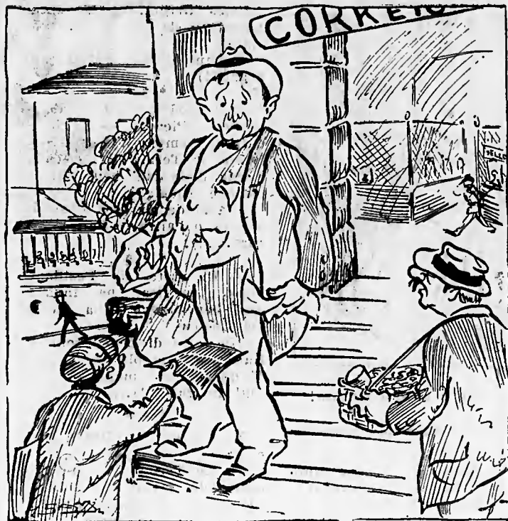
— Ho impostato due lettere!

Le tariffe postali hanno subito un altro grande aumento. (Dai giornali).