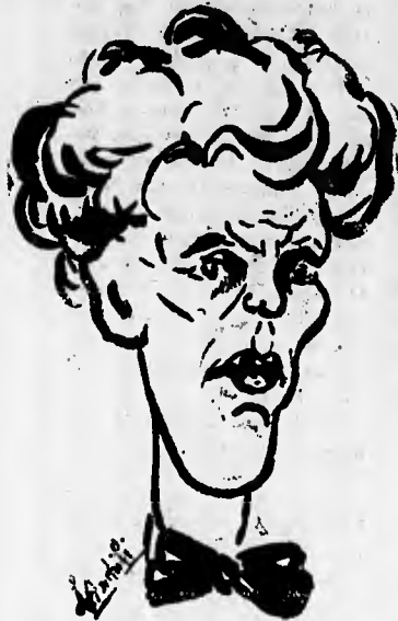
Lo scultore Eugenio Prati