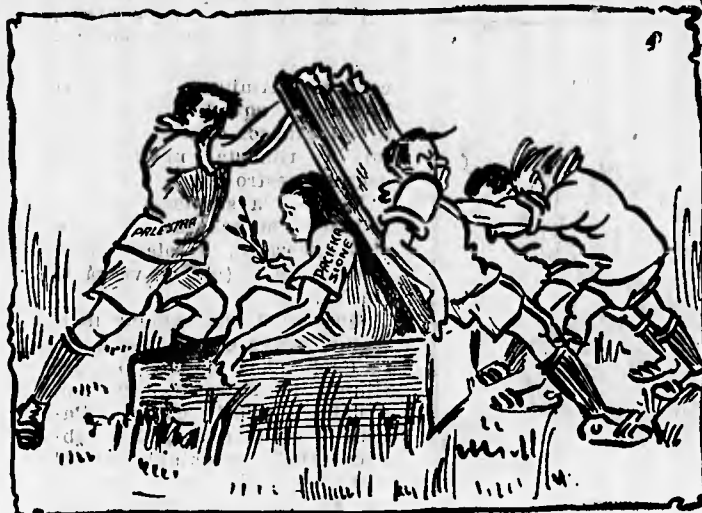
Palestrino — Finché resisto io, non ci riuscirete!