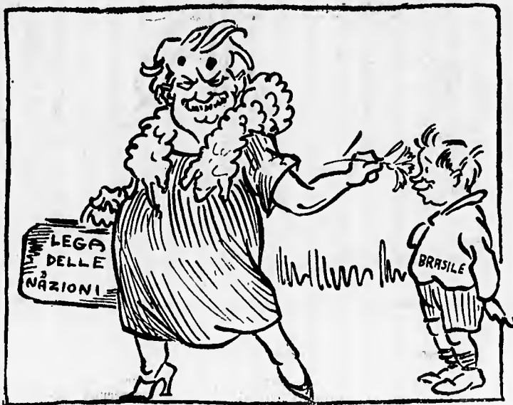
Lloyd George — Entra simpatico, outra vez... Il brasiliano — Não! Não embarco mais naquella canôa!

Lloyd George ha fatto delle pressioni perché il Brasile ritorni in seno alla Lega delle Nazioni. (Dai giornali).