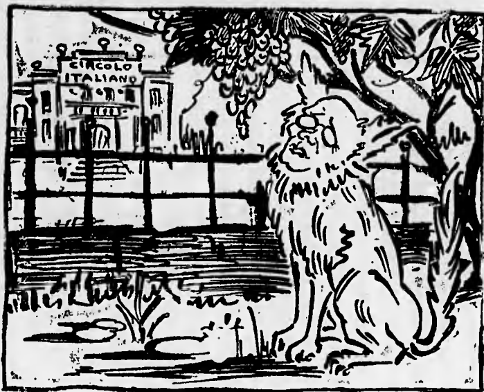
R. Occhetti — L'uva del Circolo non è ancora matura!