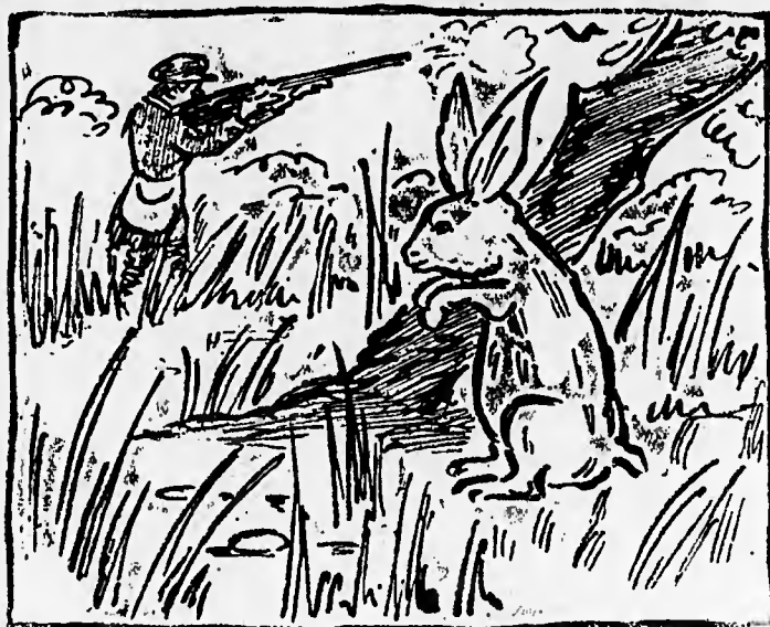
La lepre — Fosse vero!

verdi selve selvagge; se congiungesti con il tuo volo aquilino due emisferi; se insomma hai fatto quel che hai fatto, e sei quel che sei, non lo devi forse a me, che sono — e sarò nei secoli — il tuo maestro e il tuo duce?