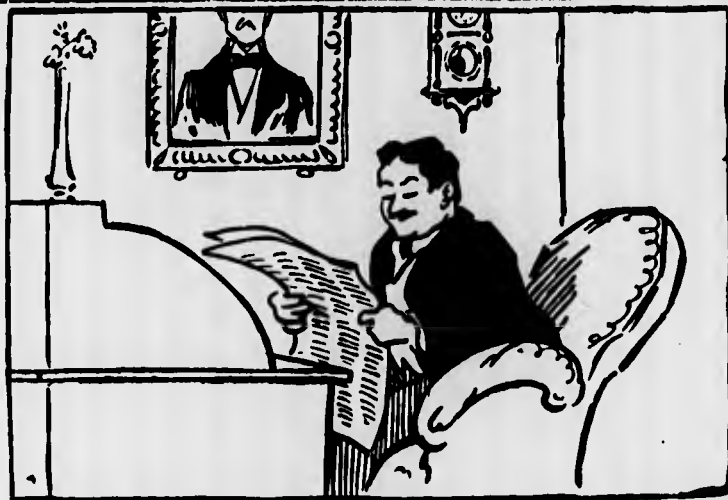
Il lettore — Finalmente comincio a capire qualche cosa sulla situazione. Prima, coi commenti del Fanfulla , mi sembrava d'increscere...