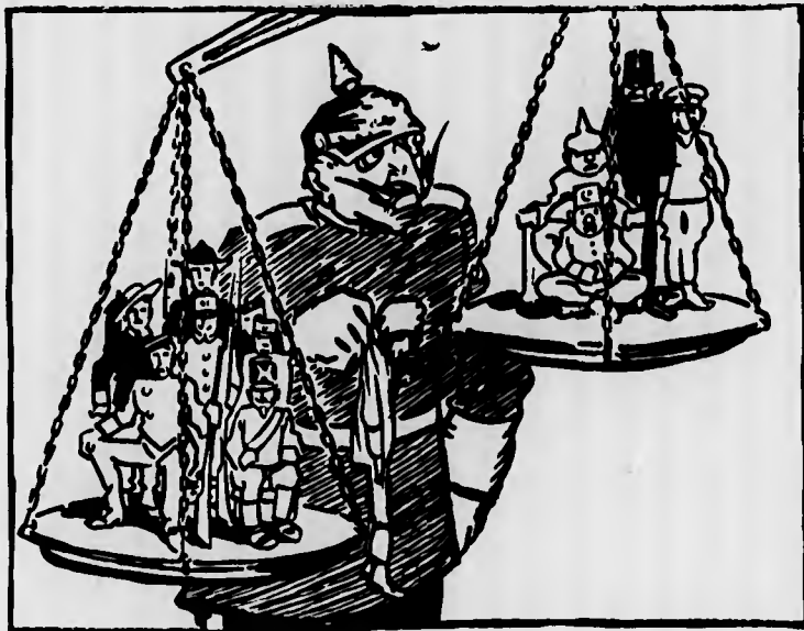
IL KAISER: — Strano! Ho tolto questo qui dalla bilancia persuaso di vederla spostare a mio favore, invece non si è neanche mossa!