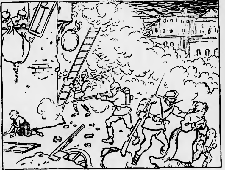
— «Siamo venuti a liberarvi dal... giogo inglese!»

nella forma che suggerite nella vostra lettera aperta. Indire lo «scopero generale» dei sottoscrittori, fino a che quel «cavaliere» non abbia versato il suo contributo, potrebbe essere una misura efficace, ma potrebbe anche costituire un grave pericolo. Anzitutto dei sussidii ce n'è bisogno giorno per giorno e poi chi sa a quanti non parrebbe vero di prendere questo pretesto per non pagare.