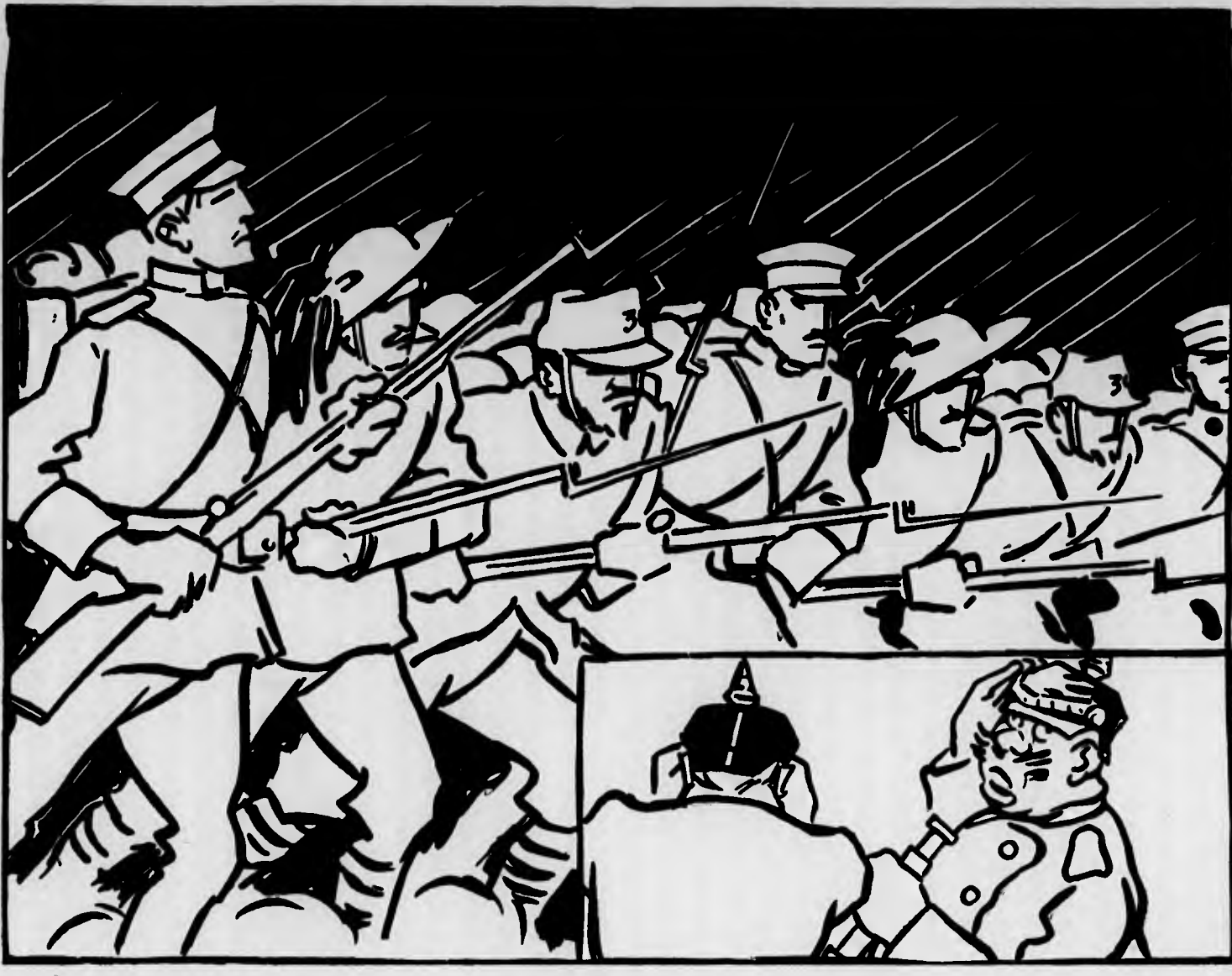
— Accidenti! Il nostro colpo ha servito per far aprire gli occhi ai nemici!