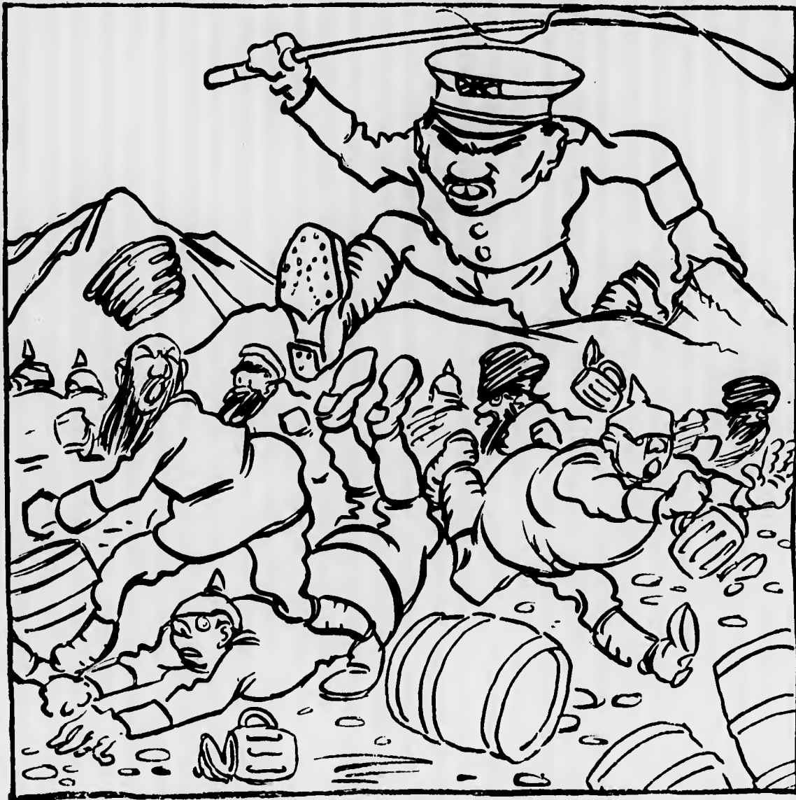
Chi potrà, da un momento all'altro, mettervi fine.