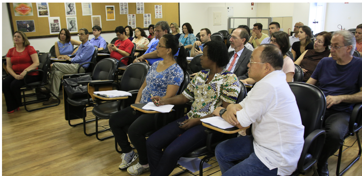
Discussões procuram estratégias em consonância com o desenvolvimento institucional