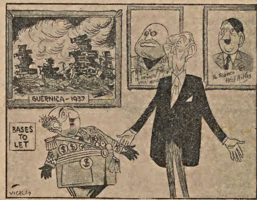
«Por qué tanto barullo, doctor? ¡También yo soy demócrata cristiano!» (Reproducido del «Evening Standard», de Londres)

La conferencia se dará en español. Se invita a cuantos se interesan por la cultura hispánica, a las entidades culturales de Toulouse y a los socios de este Ateneo. La entrada al acto es gratuita.