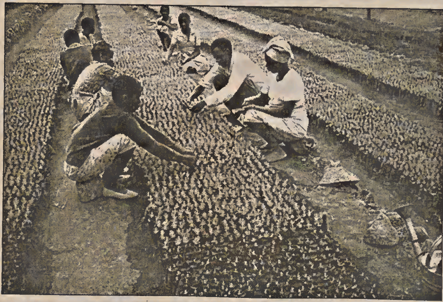
Para el capital el inmigrante es un trabajador de lujo: rendimiento satisfactorio a bajo coste

Por nuestra parte queda una responsabilidad, la de ser traidores a nuestra condición natal y luchar del lado de los que no vienen de ningún sitio ni pueden ir a ninguna parte. El arma: el Internacionalismo Solidario, la acción y menos palabras.