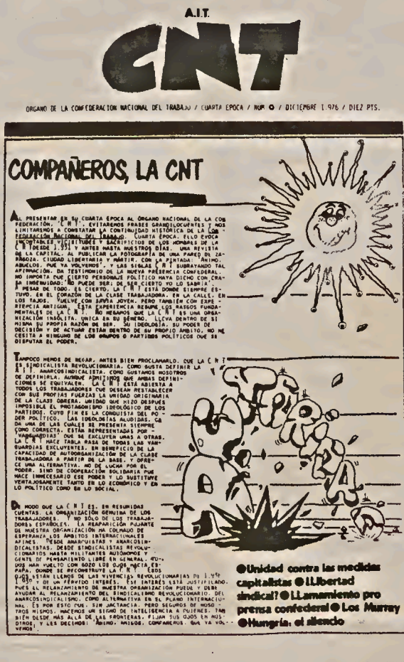
Portada N° 0 del periódico CNT

Los compañeros del C. R. de Asturias-León han podido completar su colección de CNTs atrasados gracias a la solidaridad de particulares, sindicatos y locales. Únicamente les falta para poder encuadernarla el número 0, cuya portada, aunque en malas condiciones aparece al lado. Es importante que no se confunda con el CNT N° 0 extraordinario "Acción Sindical".