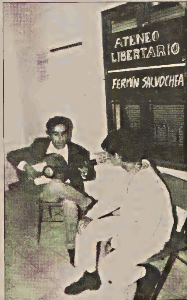
El Ateneo Libertario Fermín Salvochea de Puebla-Coria organizó en Puebla del Río, Sevilla, una velada flamenca en la que participaron miembros de la Entidad Libertaria como queda reflejado en la fotografía.