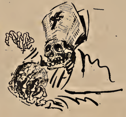
(Pasa a la página 2)

Pues nadie ignora que en América Latina, ni siquiera para demostrar la excepción de la regla, absolutamente ninguno de estos cruzados por el pecho, han dado en toda su vida un