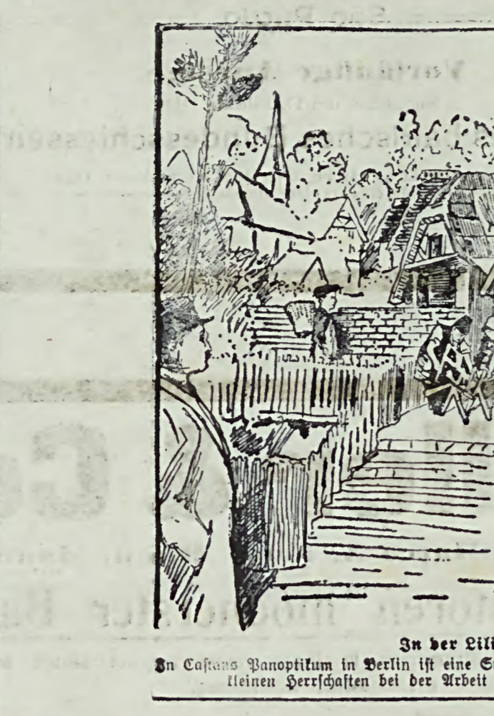
In der Silpananer-Stadt. In Cafano Banopitum in Berlin ist eine Stadt der Silpananer aufgebaut, in der man die kleinen Berufsstände bei der Arbeit und beim Vergnügen beobachten kann.

den. Und ich sehe alle herüber hören. Erlösende Ablenkung ist dies Gespräch.