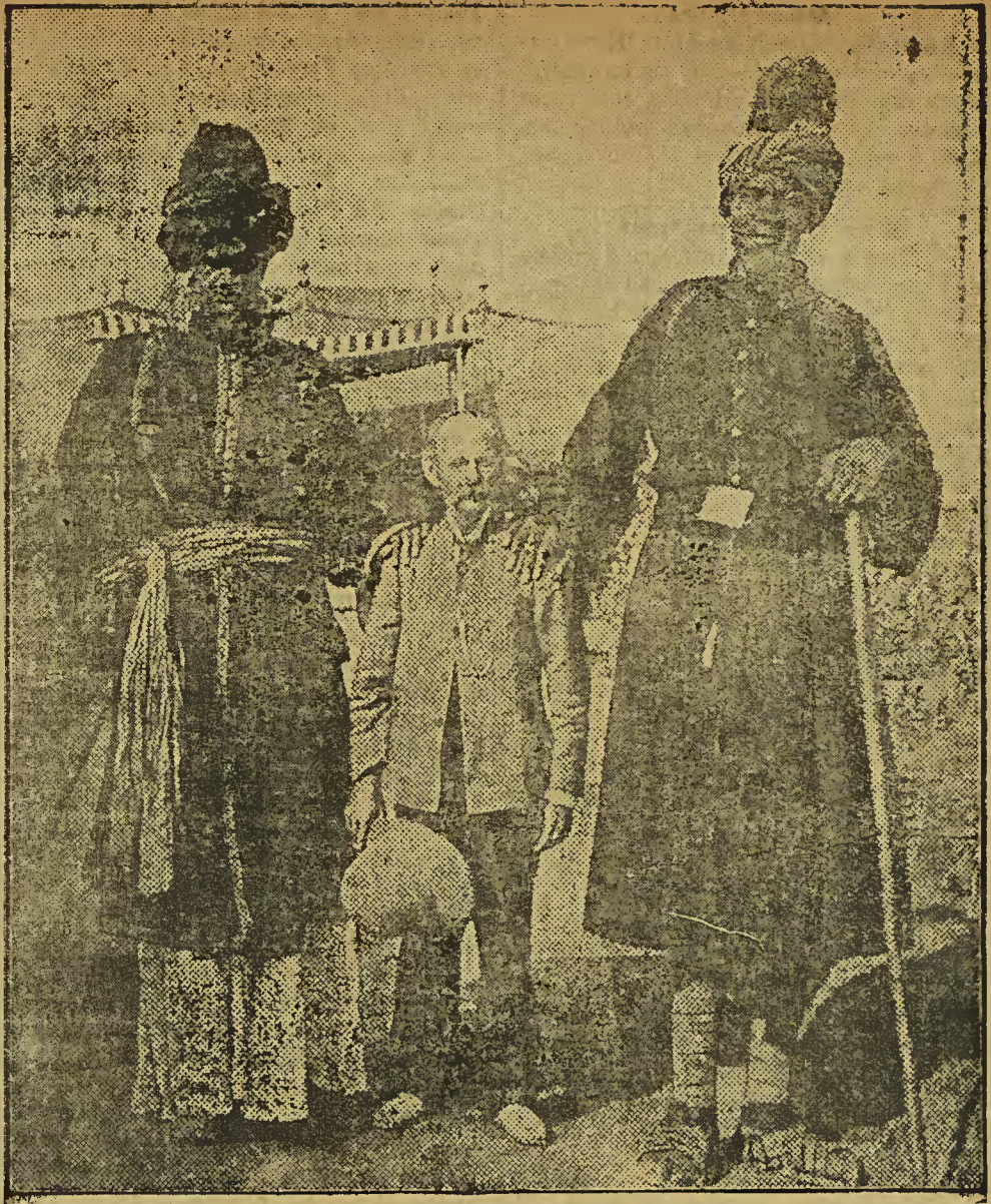
Indische Riesen, von denen jeder 2 \frac{1}{2} Meter hoch ist.

gemeldet und werde unter Kontrolle kommen. Gewiss machte man dem Menschen den Standpunkt klar; die Klägerin wurde aber mit ihrer Forderung auf Grund des § 123 der Gewerbeordnung (wegen lüderlichen Lebenswandels) abgewiesen!!! So — «von Rechts wegen». Und der saubere Möser, der nicht bloß gegen alle guten Sitten, sondern auch gegen § 124 der Gewerbeordnung verstossen hat, geht frei aus. Da er «als Mann seiner Frau» sich doch ein bisschen schämt, würde es sich empfehlen, ihn zum Ehrenvorsitzenden eines Sittlichkeitsvereins zu machen.» Hierzu sind allerdings Kommentare nicht nur überflüssig, sondern unmöglich.